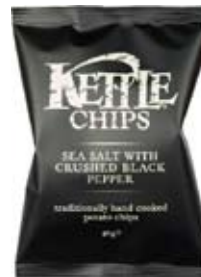
Sea Salt & Crushed Black Pepper