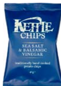
Sea Salt & Balsamic Vinegar